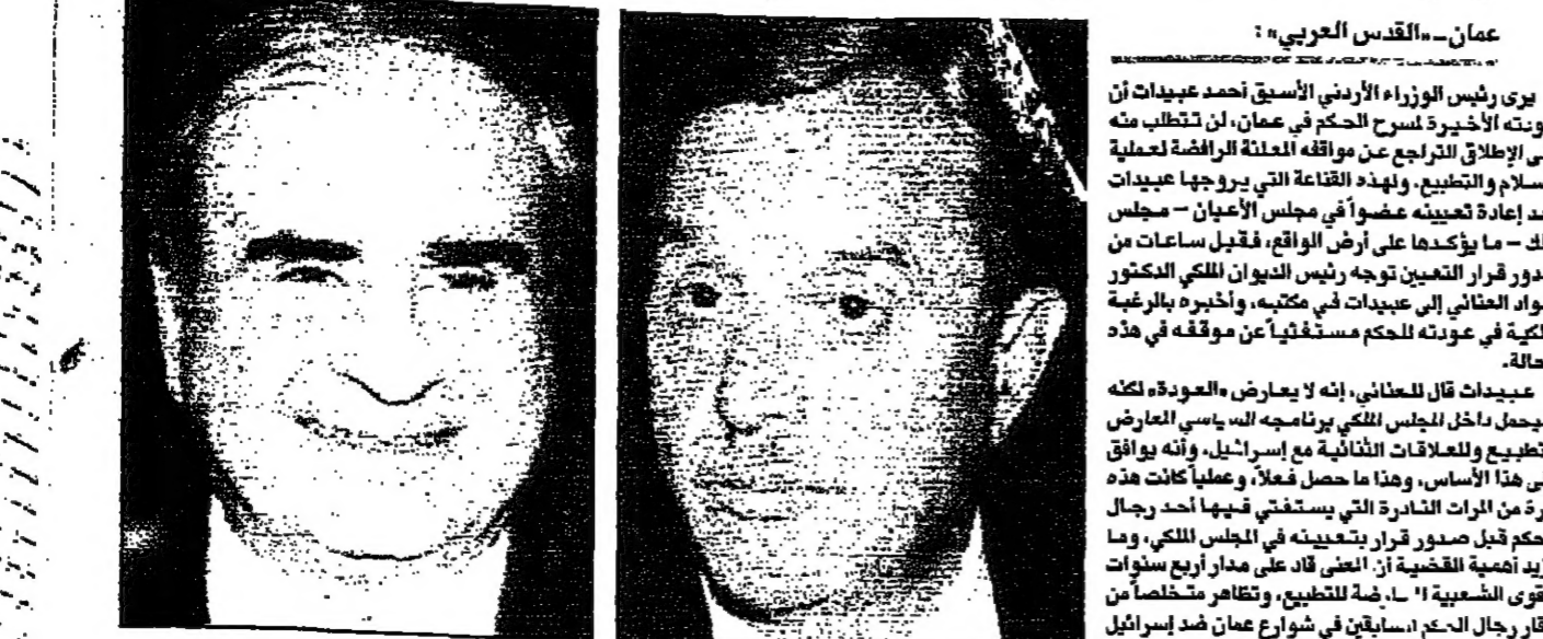
عنان - القدس العربي -